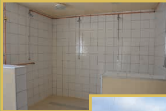
Réfection du carrelage des douches de la salle des Vigneux