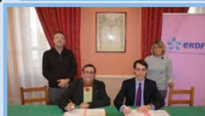
Signature d'une convention avec ERDF Décembre 2014