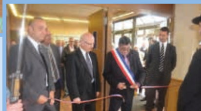
Inauguration expo sur la grande Guerre Octobre 2014