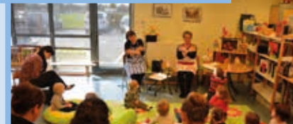
Bébés lecteurs Mai 2014