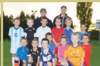
Equipe U10 - U11