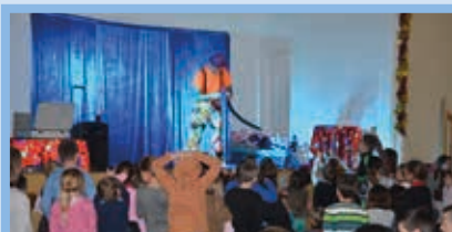
Noël des enfants Décembre 2014