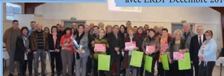
Remise Prix Fleurissement Réunion accueil nouveaux habitants Décembre 2014