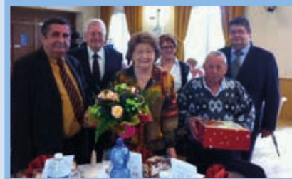
Repas des Aînés Novembre 2014