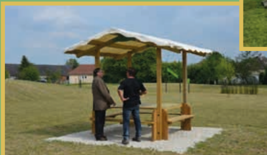
Aménagement d'une aire de pique-nique et de bancs sur l'aire de loisirs St Exupery