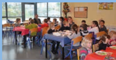
Repas de Noël des enfants Décembre 2014