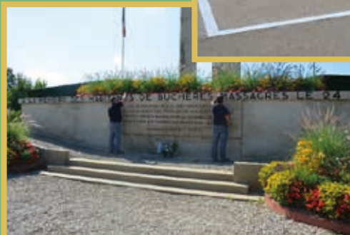
Réfection des écritures du Mémorial