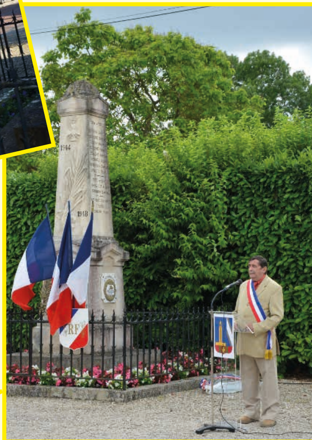
Cérémonie Commemorative du 14 Juillet Fête nationale