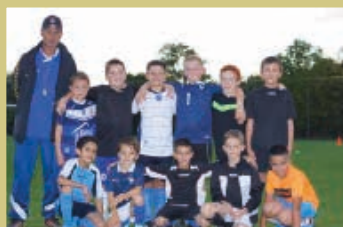
Equipe U8 - U9