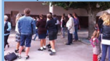
Rentrée des classes Septembre 2014