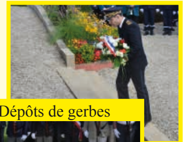
Dépôts de gerbes