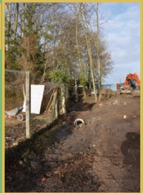
Travaux Rue des Prés