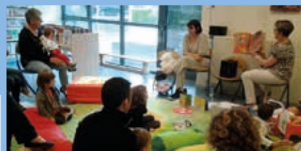
Bébés lecteurs Mars 2014