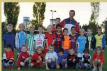
Equipe U7 - U8