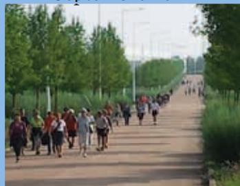
Randonnée pédestre Septembre 2014