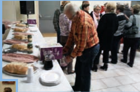
Soirée Beaujolais Novembre 2014