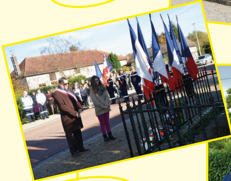
Cérémonie Commemorative du 11 Novembre Armistice 1918