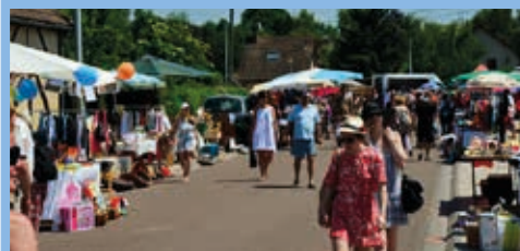
Vide grenier Juin 2014