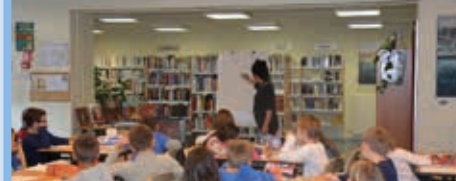
Animation illustratrice Octobre 2014