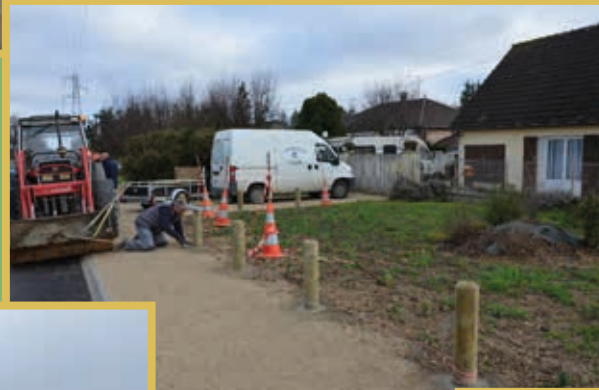
Création d'un passage pour pié- tons - Avenue des Martyrs