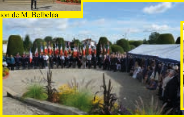
Une minute de silence en mémoire de nos martyrs