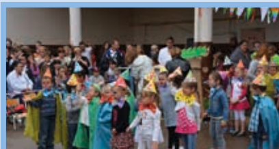
Fête des écoles Juin 2014