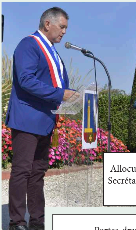
Allocutions de M. le Maire et Mme la Secrétaire Générale de la Préfecture de l'Aube