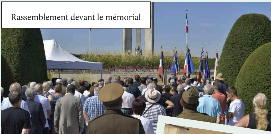
Rassemblement devant le mémorial