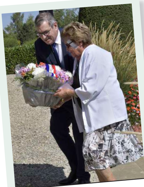
Dépôt de gerbe