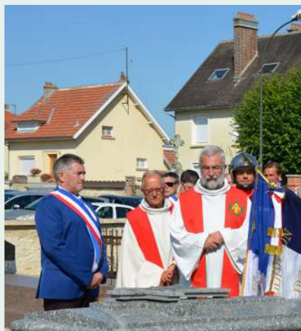
Bénédiction des tombes