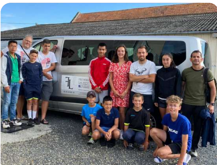
L'ensemble des jeunes ayant participé à la tournée d'été

Aussi, le club propose autant avec les écoles de Buchères que de Verrières des cycles scolaires afin de permettre aux jeunes de nos écoles de bénéficier de cours de tennis. Sans oublier le partenariat avec le collège Marie-Curie et la section tennis où notre coach intervient tous les mardis et jeudis pendant deux heures.