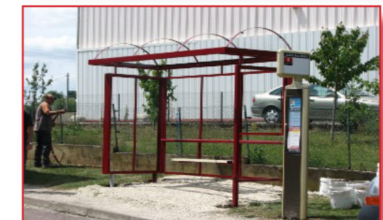
Installation des abris bus par la TCAT