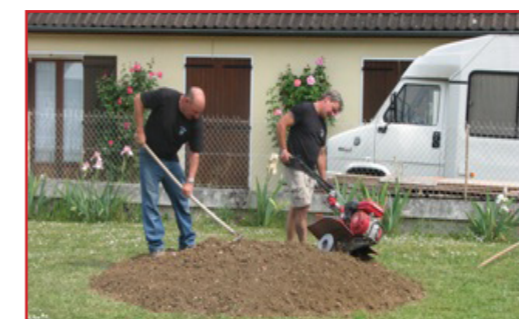
Création d'un parterre floral - Rue des Anémones