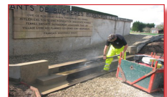
Nettoyage du Mémorial du 24 Août 1944