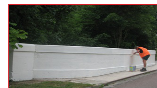
Réfection des peintures - Pont de l'Hozain Route de Maisons blanches