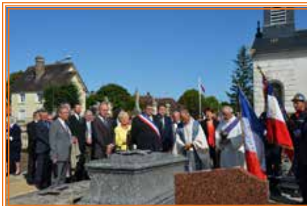
Bénédiction des tombes