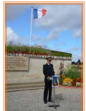
Allocution du Secrétaire Général de la Préfecture