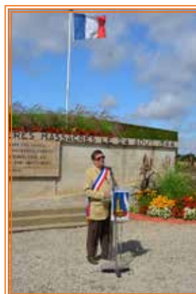
Allocution de Monsieur le Maire