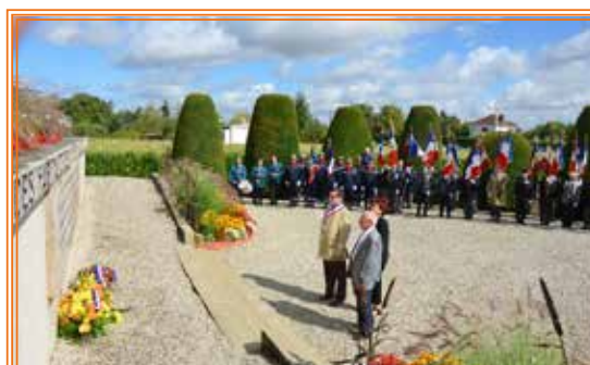
Dépôt de gerbes