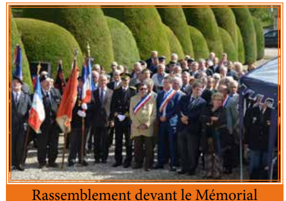
Rassemblement devant le Mémorial