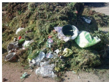
Ce n'est pas avec ceci