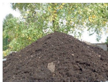
qu'on arrive à obtenir cela