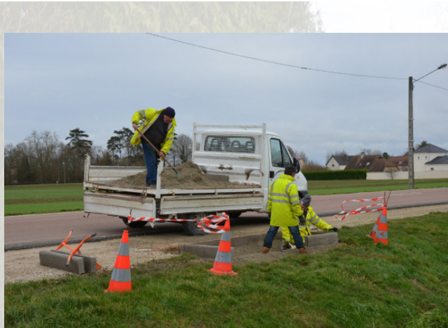
Création de parterres floraux Ave. des Martyrs