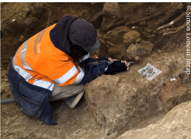
Dégagement des squelettes en fouille fine