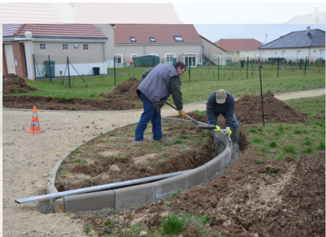
Création de massifs avec pose de bordures