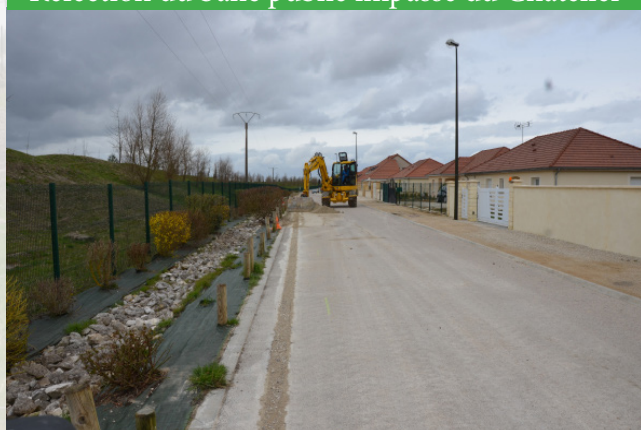
Renforcement de la ligne SFR