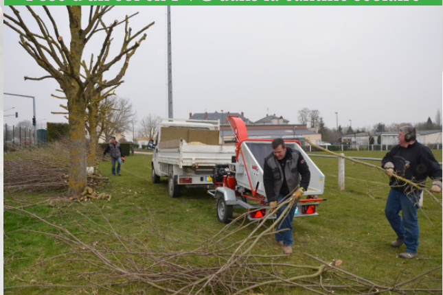
Taille et broyage des coupes d'arbres le long du stade avec récupération des copeaux