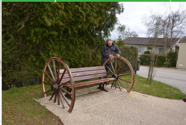
Réfection du banc public impasse du Châtelier