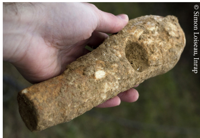
Manche en bois de cerf d'une hache dont il manque la partie tranchante en silex

Un film pour comprendre tout l'intérêt de ce site archéologique est disponible sur le site