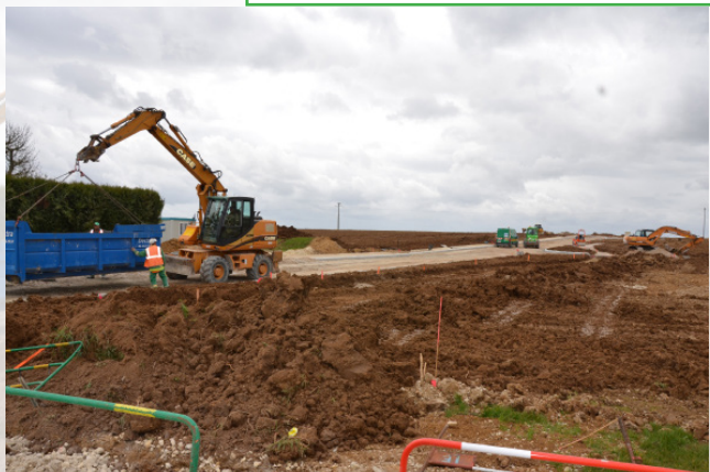
Terrassement et création des trottoirs