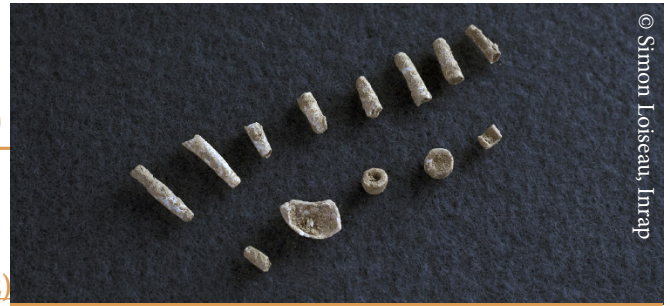
Perles de colliers en coquillages retrouvées dans la tombe

(Communiqué de presse de l'Inrap du 10 Décembre 2012)