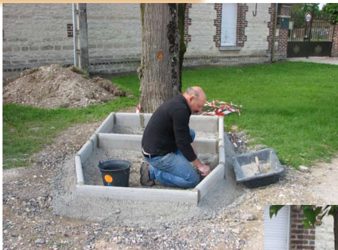
Aménagement d'un parterre floral devant le CPI