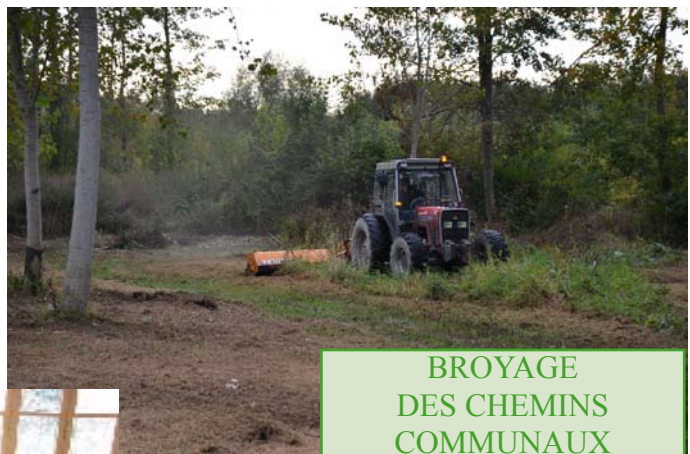
BROYAGE DES CHEMINS COMMUNAUX