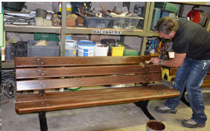
RAFRAICHISSEMENT EN LASURE DES BANCS DE LA COMMUNE