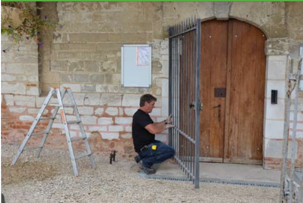
RÉFECTION DE LA GRILLE DE LA CHAPELLE