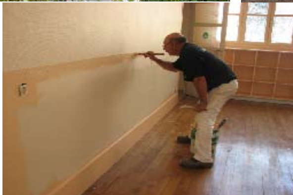
RÉFECTION DE LA SALLE DE CLASSE DE L'ÉCOLE PRIMAIRE