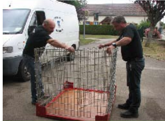
CRÉATION D'UNE CAGE POUR LES CHIENS ERRANTS