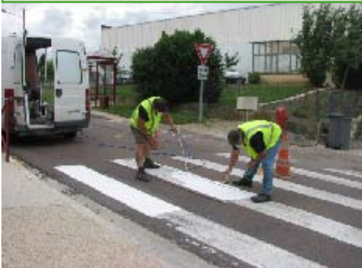
RÉFECTION DE LA PEINTURE DES BANDES SIGNALÉTIQUES