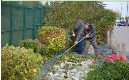
ENTRETIEN DES ESPACES VERTS