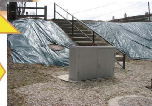
Changement des pompes de la station de relevage Pont de l'Hozain