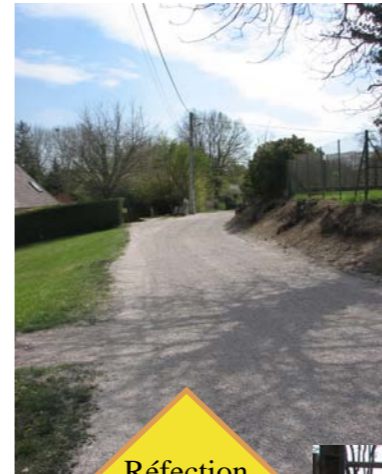
Réfection du Chemin des Vigneux

Ouverture du Lundi au vendredi de 9h à 12h et de 14h à 16h30