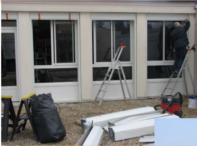
Changement des volets roulants de l'école maternelle