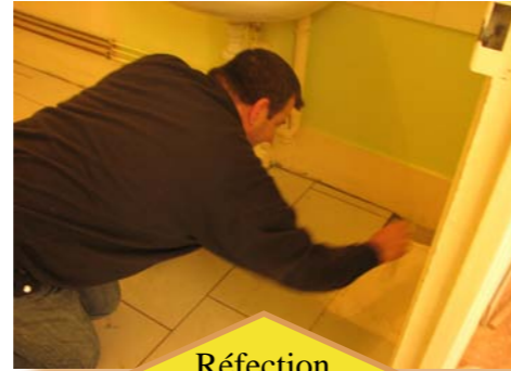
Réfection des logements communaux