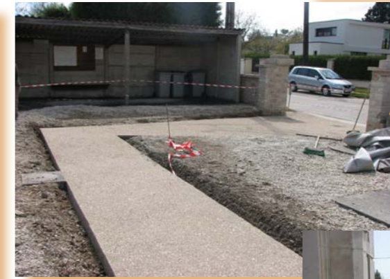
Aménagement d'une rampe d'accès pour personne à mobilité réduite (église et cimetière)