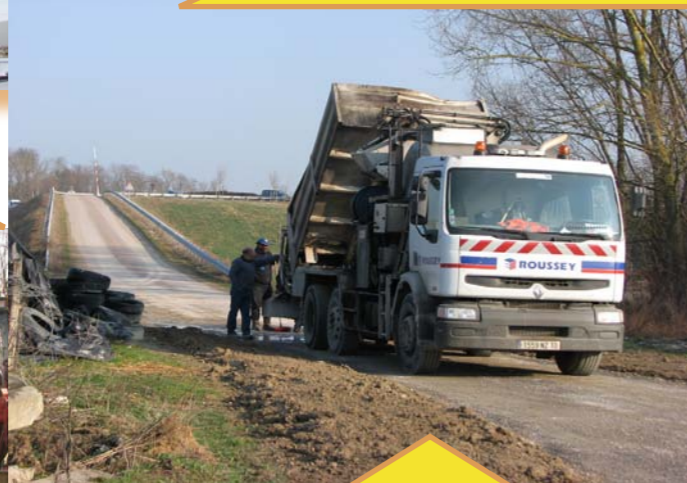
Réfection de la chaussée Chemin de la Voie de Vaux