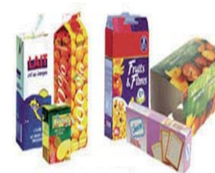
les briques, écrasées