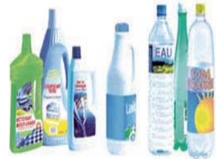
les bouteilles plastiques, écrasées (bouchons inclus)