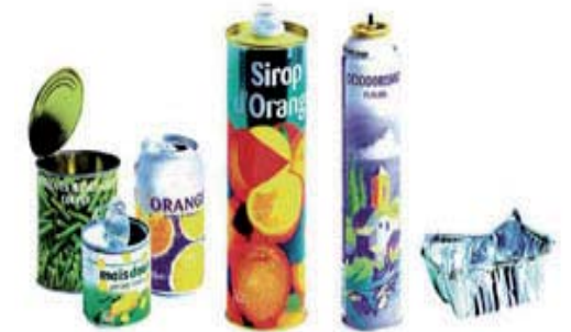
les emballages acier et aluminium, vides et rincés