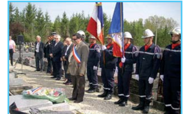
Dépôt de gerbe