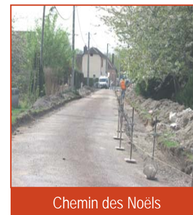
Chemin des Noël's