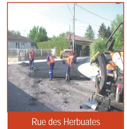
Rue des Herbuates