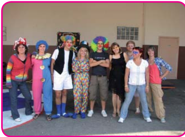
L'équipe d'animateurs au grand complet

Deux camps pour les 7-9 ans et 10-12 ans se sont déroulés à Etourvy, proposant équitation, VTT, découverte des animaux de la ferme, jeux en groupe et... bonne humeur inaltérable pour le plaisir des petits campeurs. Cette année, les ateliers avaient le cirque en thème principal. Les enfants se sont investis dans la préparation du spectacle de fin de centre, notamment en fabriquant leurs matériels et leurs déguisements et ont présenté des numéros de «pros» aux parents venus les applaudir dans la cour de l'école primaire.