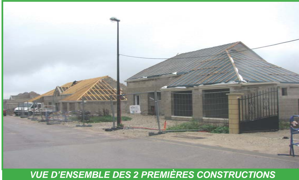
VUE D'ENSEMBLE DES 2 PREMIÈRES CONSTRUCTIONS