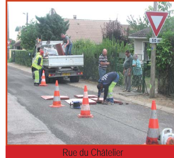
Rue du Châtelier

Pour votre sécurité à tous, la pose de coussins berlinois a été nécessaire dans certaines rues de la commune.