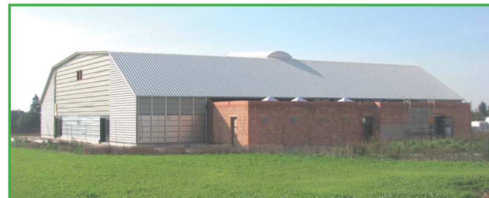
VUE D'ENSEMBLE PHOTO PRISE LE 23 SEPTEMBRE 2010 TENNIS ET CLUB HOUSE