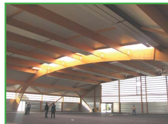
COURS DE TENNIS VUE INTÉRIEURE