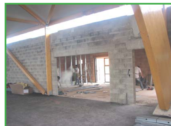
CLUB HOUSE VUE INTÉRIEURE