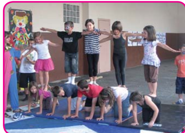
Le talent, ça s'apprend ! et les enfants ne manquent pas d'obstination