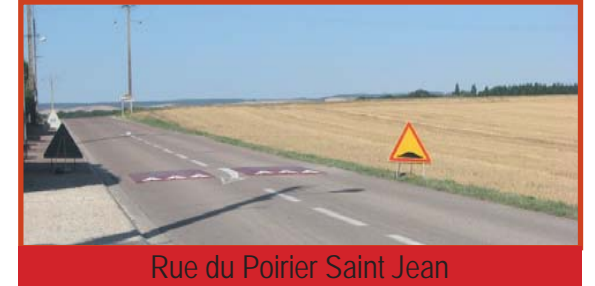
Rue du Poirier Saint Jean