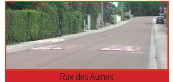
Rue des Aulnes