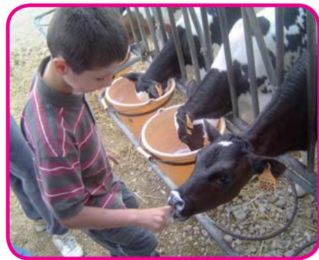
Découverte des animaux de la ferme