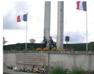
Appel des morts par les sapeurs pompiers de Buchères.