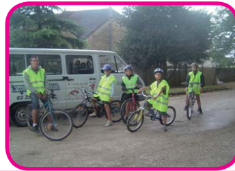
Le VTT, une excellente occasion de se défouler les jambes.