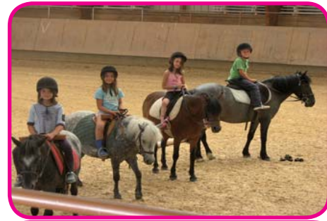
Cours d'équitation à Lagesse.