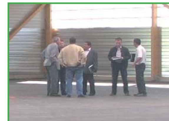
RÉUNION DE CHANTIER DU 23 SEPTEMBRE 2010