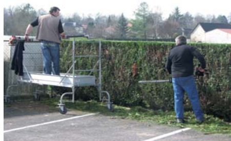
Taille des tuyas devant la salle des fêtes