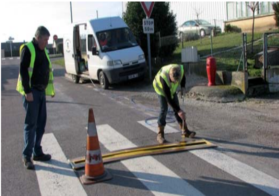
Marquage au sol pour les arrêts de Bus TCAT